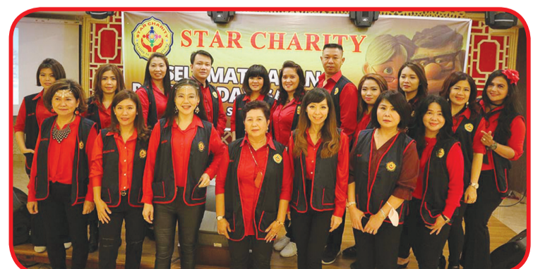
Seluruh pengurus dan anggota panitia penyelenggara berfoto bersama.