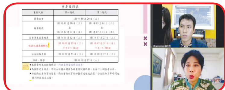
Pembicara dalam Promosi Online Penerimaan Siswa National Quemoy University.