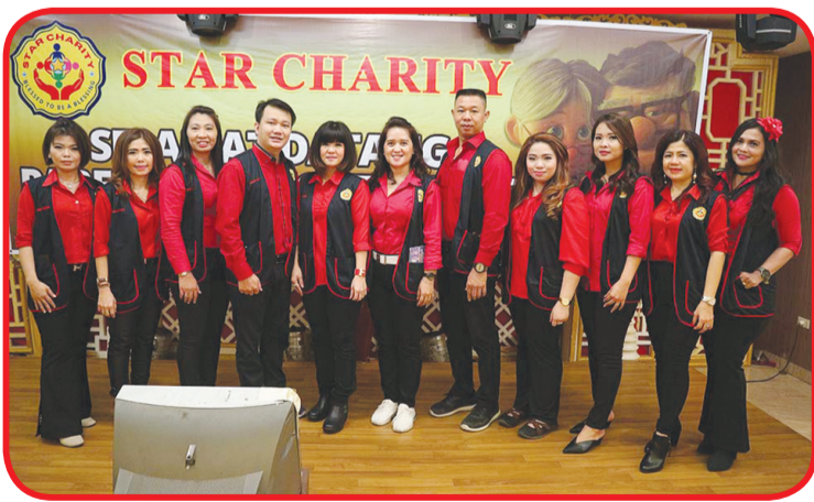
Seluruh pengurus, Pembina dan Penasehat Star Charity Medan berfoto bersama.