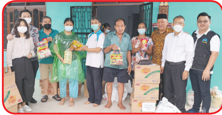
Pengurus Rotary Club Deli Medan berfoto bersama warga di Kec. Hamparan Perak.