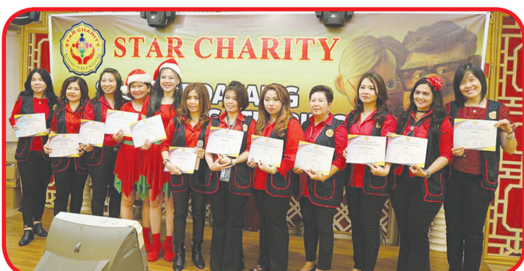
Seluruh anggota panitia menerima piagam penghargaan.