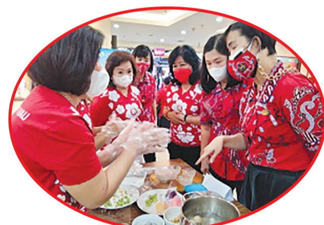
Pengurus wanita PSMTI Riau dan PSMTI Pekanbaru sedang membuat onde - onde.

han," jelasnya. Selain itu, setiap anak mendapatkan bunga mawar untuk diberikan kepada para ibu yang ada di mall serta berbagai kegiatan lainnya. Sementara itu, Ketua Harian PSMTI Riau Dharmaji Chowmas berharap Festival